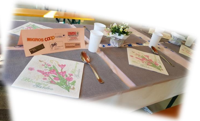
Ein Dankeschön unseren Sponsoren!