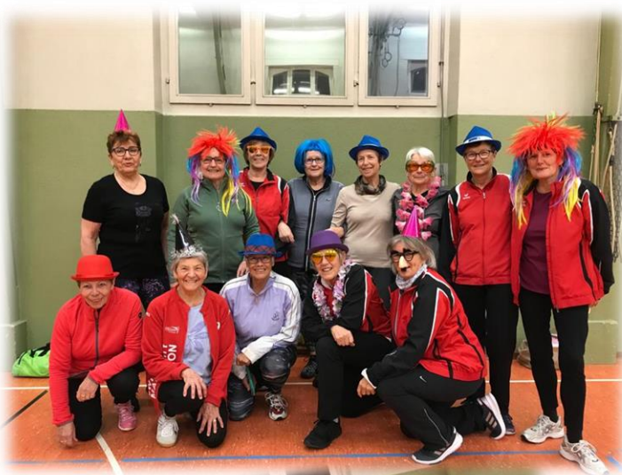
Die Seniorinnen halten an ihrer Tradition fest 😊!